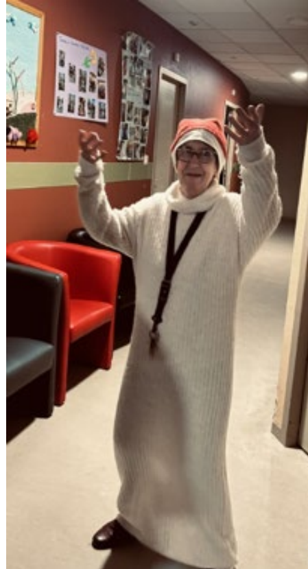
C'est la fête, on danse.