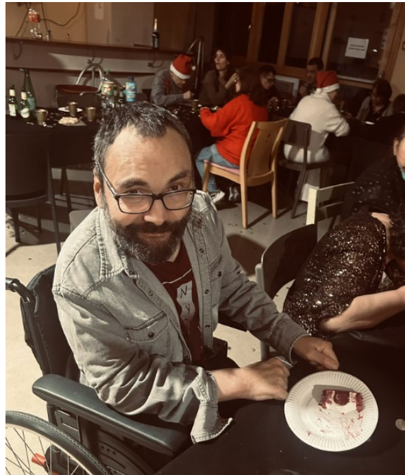
En dessert de la bûche.