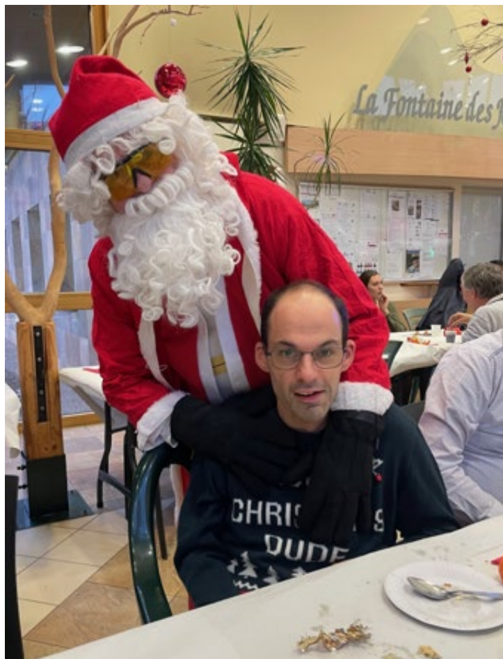
Le père-Noël nous a rendu visite.