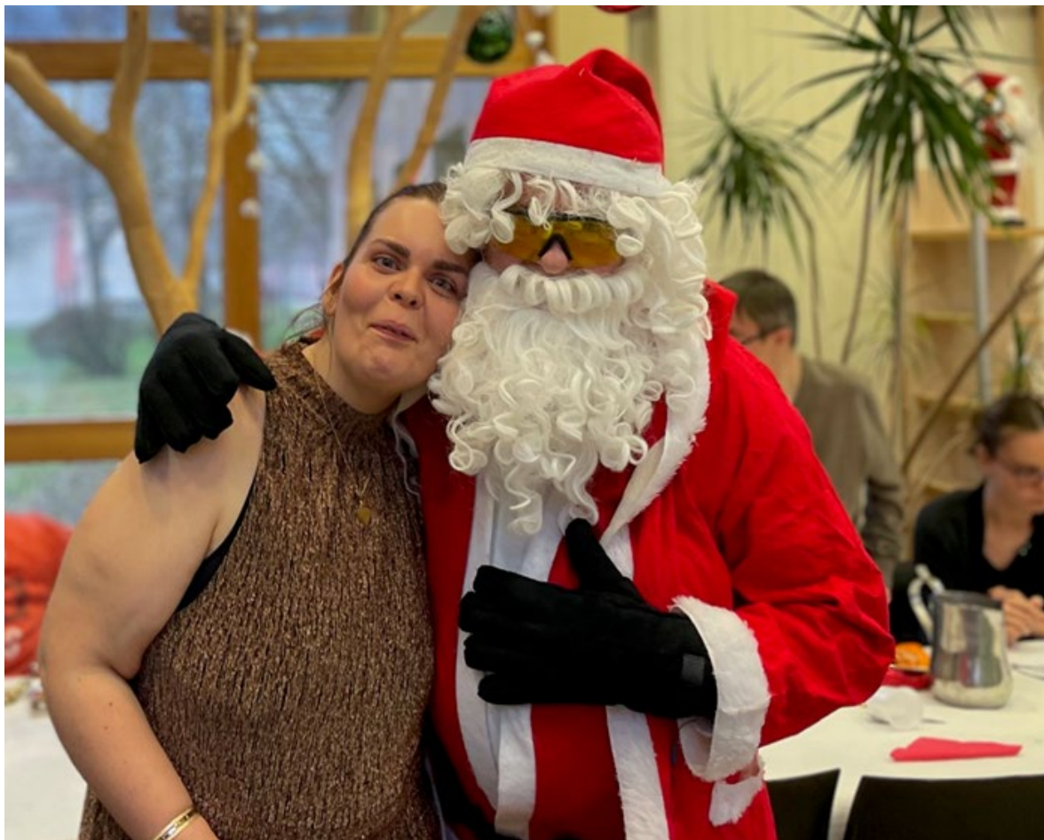
C'était la magie de Noël.