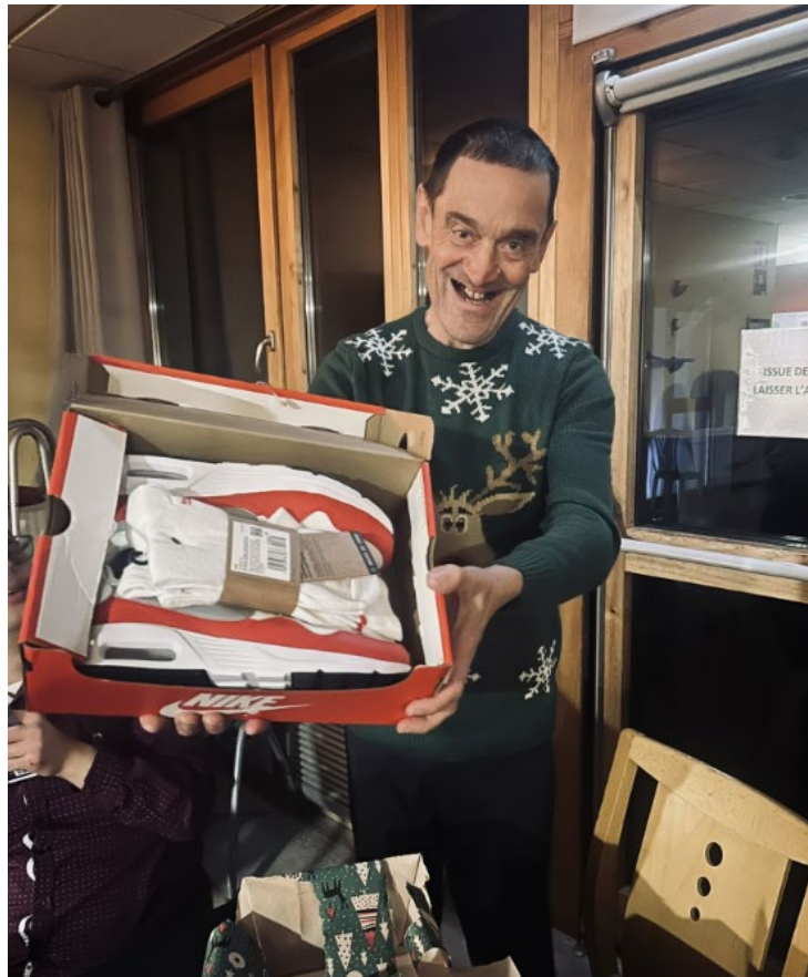
Et voilà le moment des cadeaux.