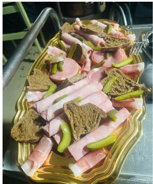
Nous avons mangé des bonnes choses, des toasts à l'apéritif.