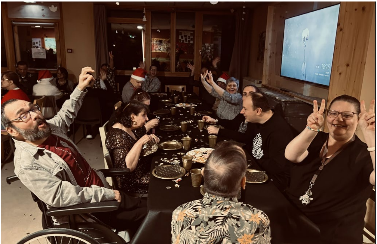
C'était super, on a bien rigolé.