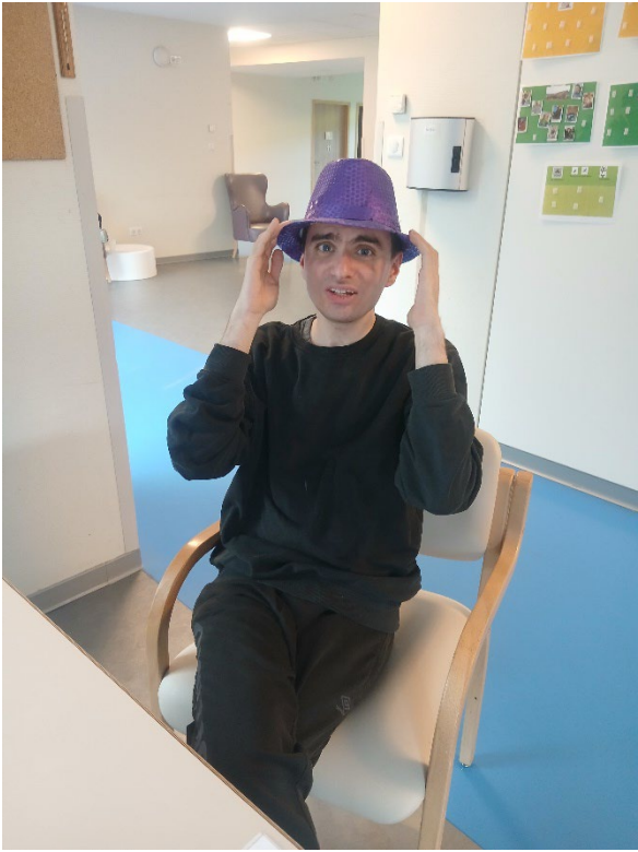
En baba-cool ou en pirate.