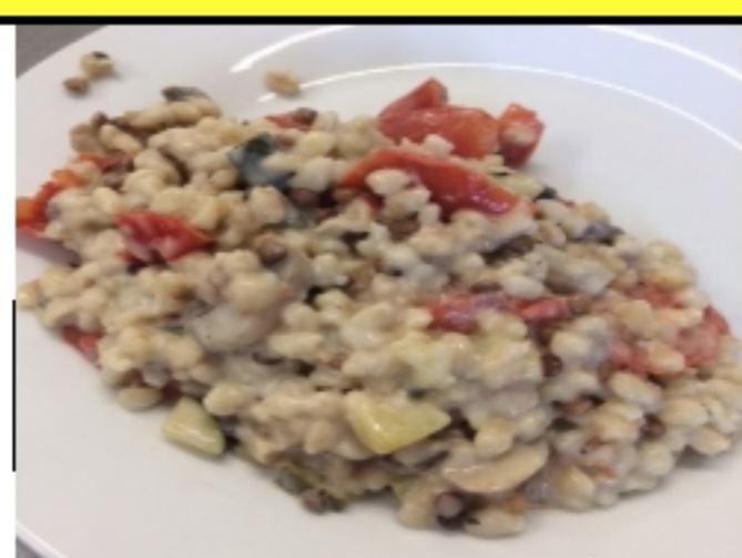
Risotto de blé