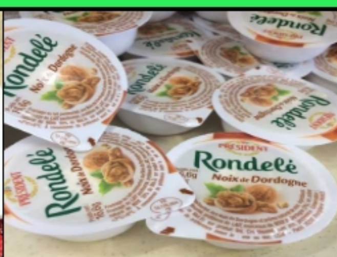
Rondelé aux noix