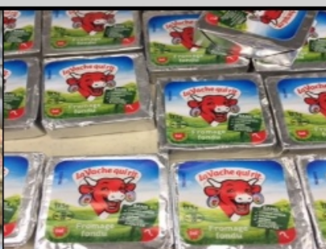
Vache qui rit