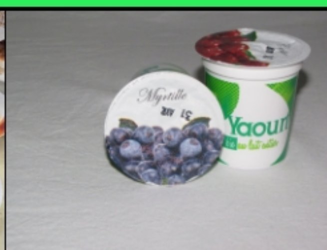
Yaourt aux fruits