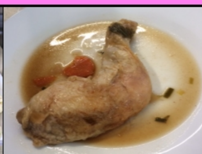
Poulet et méli mélo de choux