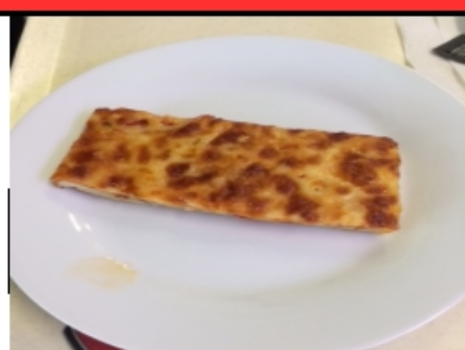
Pizza et salade iceberg