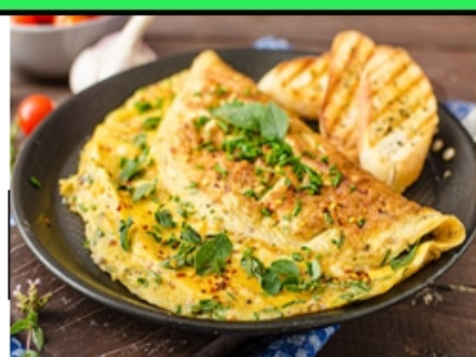
Omelette et patates