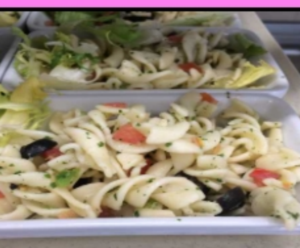
Salade de pâtes