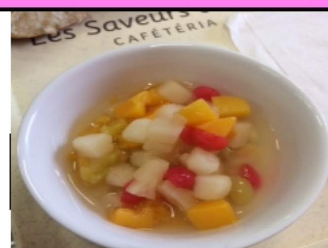
Cocktail de fruits