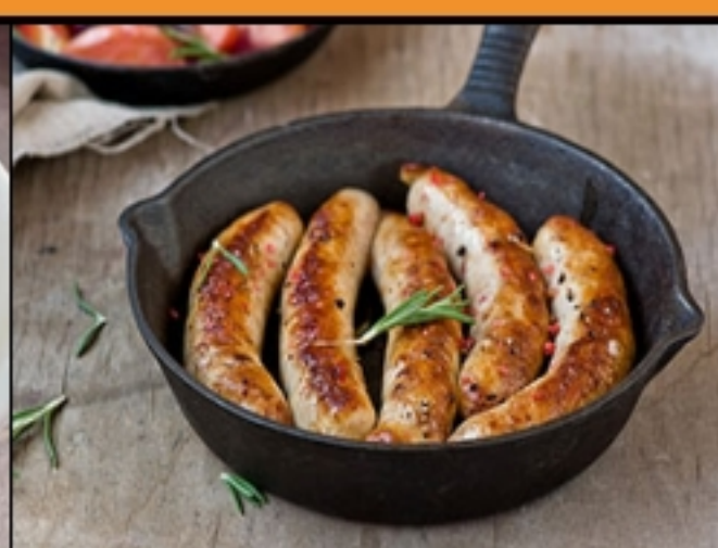
Fricadelle et courgettes