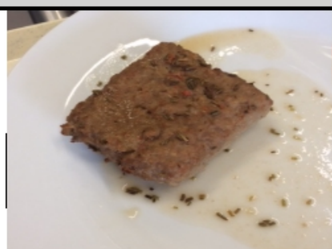
Grillardin de veau et macédoine