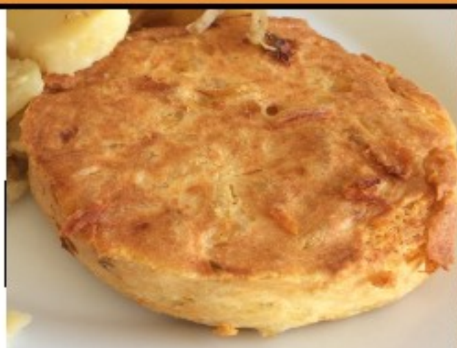
Tortilla et champignons