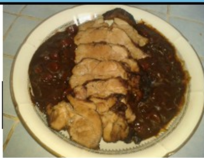
Rôti de dinde et blé