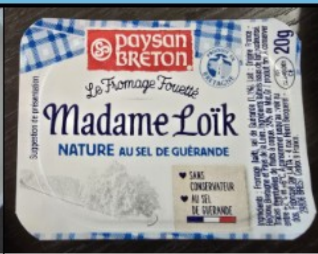
Fouetté de la Mère Loïk