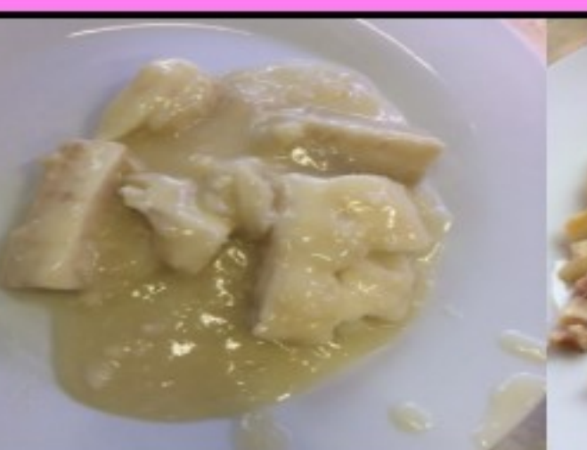
Saumon et tortis