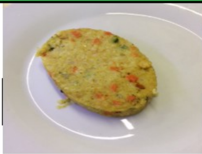
Galette et épinards