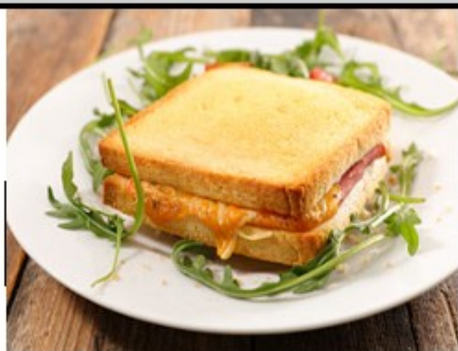
Croc jambon et légumes