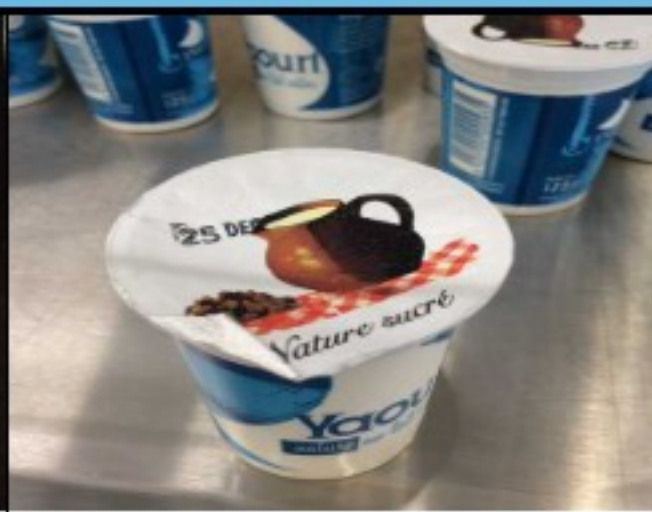
Yaourt nature sucré