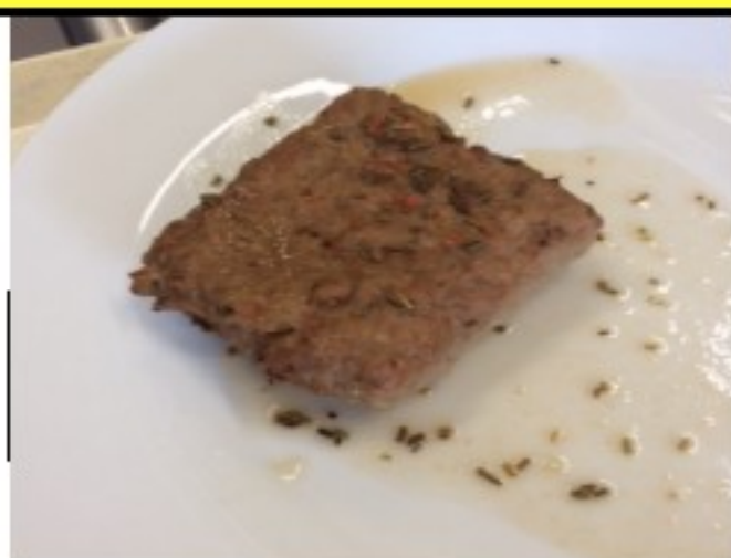
Grillardin de veau et courgettes